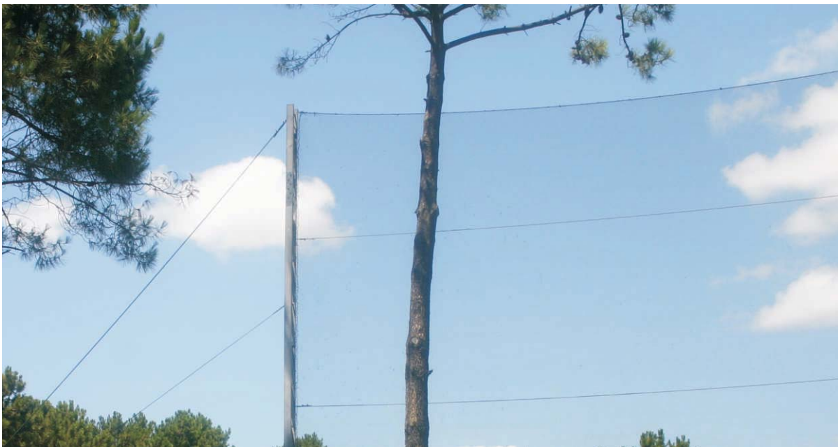
Torres duplas de tencionamento